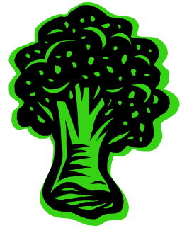
Légende accompagnant l'illustration.

moyen simple de convertir votre bulletin en site Web. Une fois votre bulletin terminé, vous n'aurez plus qu'à le convertir en site Web et à le publier.